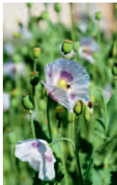
Rosa-violette Malvenblüten, Agastache mexicana und zarte Blüten des Graumohns von Pro Specie Rara (von links nach rechts).