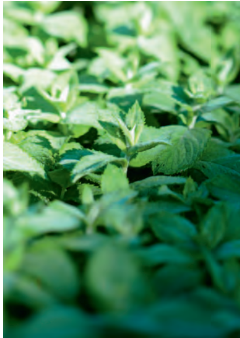
Trotz Höhenlage gedeihen die Kräuter im Puschlav mit vielen Sonnenstunden und Wärme gut.

Bei Teemischungen auf die Zusammensetzung achten: Was wirkt anregend? Was beruhigt? Aromen und Düfte sollen sich nicht gegenseitig konkurrenzieren.